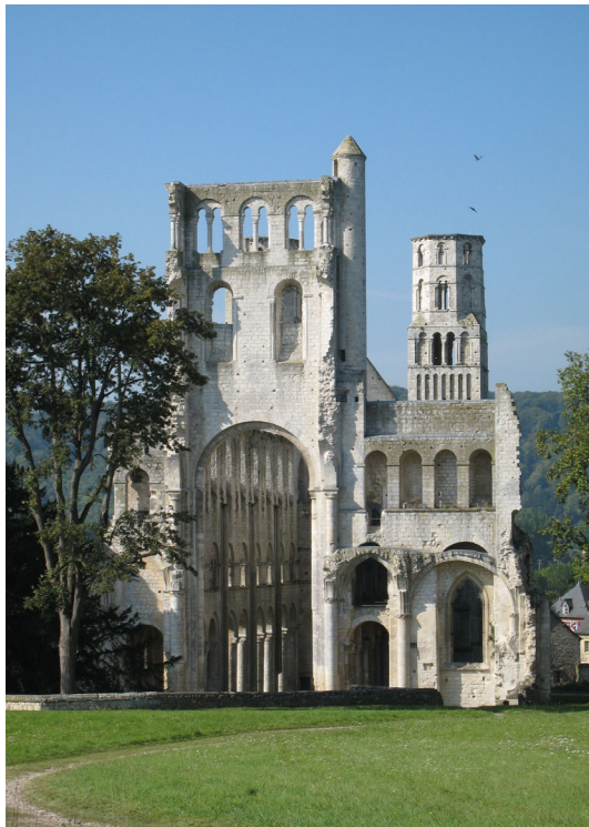
Jumièges, église Notre-Dame